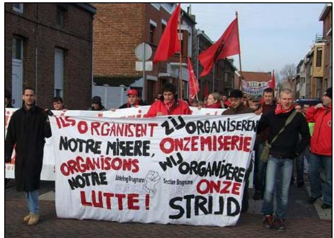
Manifestation de soutien aux travailleurs de Bekaert-Hemiksem (24 janvier)

Soyez sûr que chaque euro récolté par nos militants ou reçu sur notre compte bancaire est utilisé de la meilleure manière dans la construction d'une force politique qui lutte pour une société où les richesses ne sont plus le monopole de quelques individus exploitant l'immense majorité de la population mondiale.